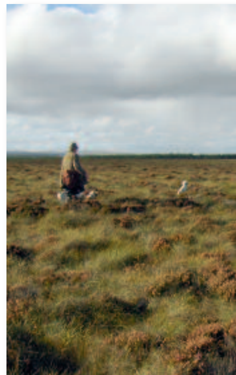
... und nichts begrenzt die Weite.

«Ein schottisches Estate zu führen, ist wie unter der kalten Dusche zu stehen, während man zuschaut,